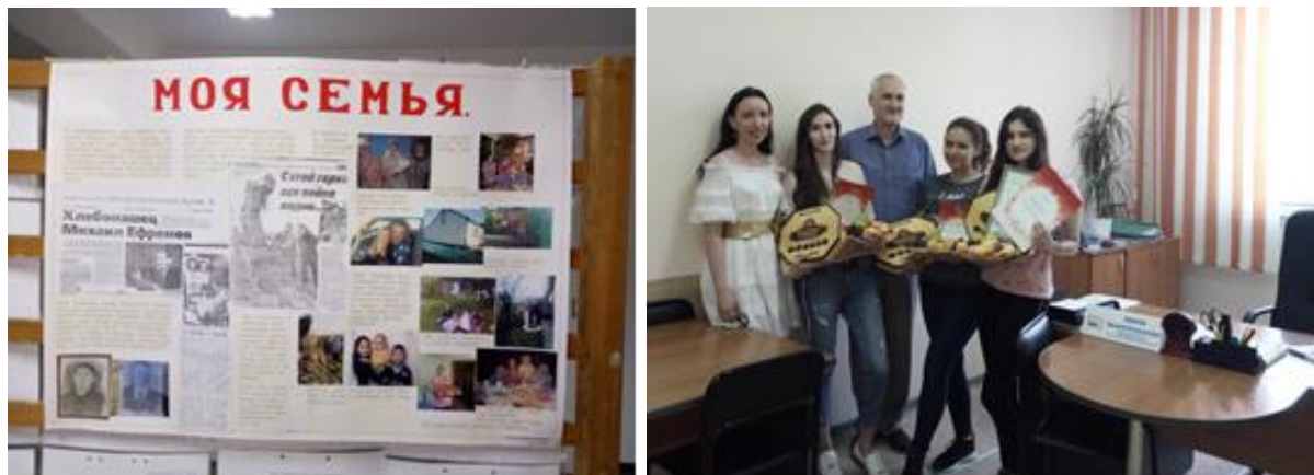
Рис. 1 – Награждение победителей первого конкурса ЭФ «Моя большая семья – хранительница традиций» (2019 год)

Конкурс проводится в следующих номинациях: презентация; видео; семейный альбом; стенгазета.