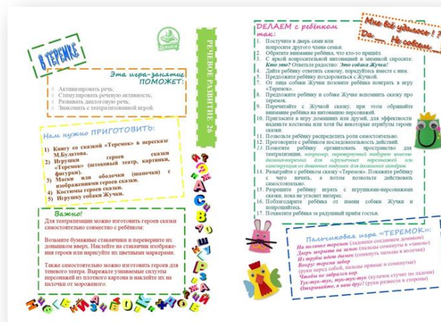
Рис. 1 – Макет карточки из комплекта «Речевое развитие»