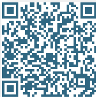
Рис. 2 – Демонстрационный фильм о творческих находках детского сада по просветительской работе с родителями

В практике Службы «Территория мудрых родителей» образовательный ежедневник «Рецепты семейного образования и воспитания» стал особым графическим консультационным пространством, предлагающим очень простые пошаговые рекомендации по моделированию игр-занятий с детьми раннего возраста и ненавязчивых образовательных и воспитательных ситуаций.